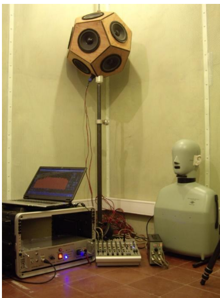
Figura 1: Fotografía de la cadena de instrumentación electroacústica para la medición de la respuesta al impulso de recintos (RIR) y cálculo de parámetros acústicos según norma ISO 3382

Tanto la señal mls como la esw y lsw, pueden producir, según la existencia de no linealidades en el sistema, distorsiones al momento de obtener la RIR, estas distorsiones ocurren en diferentes instantes de tiempo en la RIR. La técnica de barrido no solo es más inmune a perturbaciones, si no que al aplicar la deconvolución de las señales se obtiene una RIR con distorsión que puede ser eliminada. La gran ventaja de los barridos radica en que las no linealidades del sistema de medición que produce los productos de distorsión, pueden ser separados de la parte lineal de la RIR (Farina, A., 2000). Los productos de distorsión, de 2 do , 3 er , 4 to , etc. orden aparecen antes de la RIR cuando el tiempo de barrido es suficientemente mayor comparado con la duración de la RIR medida. (Ciric, D., 2007). Cada producto de distorsión no lineal está localizado a la distancia \Delta\tau según ecuación (2):